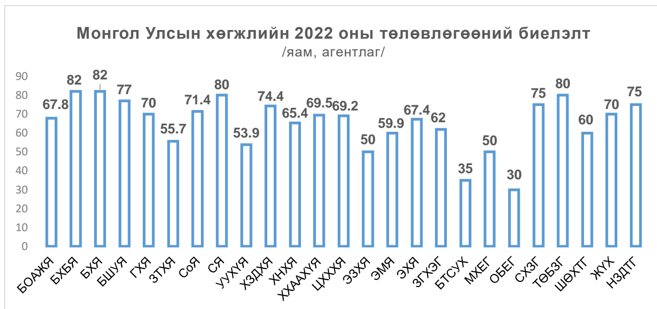
График 2. Монгол Улсын хөгжлийн 2022 оны төлөвлөгөөнд тусгагдсан төсөл, арга хэмжээний биелэлт /байгууллагаар/

Монгол Улсын хөгжлийн 2022 оны төлөвлөгөөний биелэлтээс “0” хувийн биелэлттэй дараах 19 төсөл, арга хэмжээ байгаа ба энэ нь ЭМЯ /7/, ЗТХЯ /5/, СоЯ /2/, ХНХЯ /1/, УУХҮЯ /1/, БХБЯ /1/, СЯ /1/, БОАЖЯ /1/ тус тус хариуцсан арга хэмжээ байна. Үүнд: