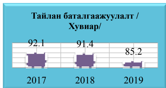
Зураг 1 /Тайлан баталгаажуулалт-хувь/