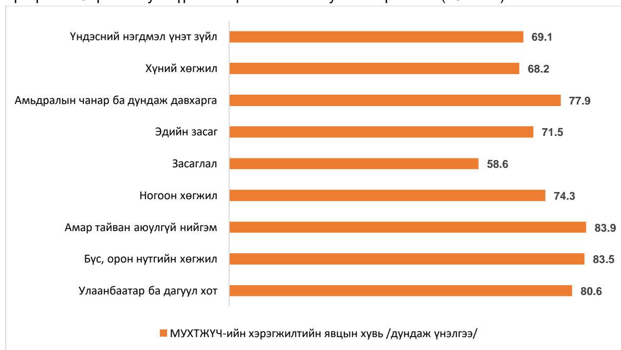
График 1. Зорилго тус бүрийн хэрэгжилтийн хувийг гаргавал: (2022 он)

2022 оны хувьд “Алсын хараа-2050” урт хугацааны хөгжлийн бодлогын I үе шатны болон Монгол Улсыг 2021-2025 онд хөгжүүлэх таван жилийн үндсэн чиглэлийн зорилго, зорилтын тухайн таван жилд хүрэх үр дүн, тоон болон чанарын шалгуур үзүүлэлт, тухайн шалгуур үзүүлэлтээр хэмжигдэх зорилтот түвшнийг он тус бүрээр тодорхойлоогүй тул Монгол Улсын Их Хурлын хяналт шалгалтын тухай хуулийн 18.3.3 дахь заалтын дагуу хүрэх дүнг тооцох боломжгүй байна.